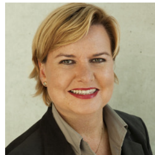
Dr. Eva Högl, MdB

Bericht des NSU-Untersuchungsausschusses mehr zur Konferenz