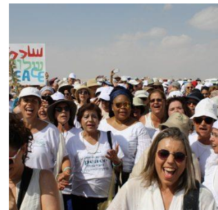
Women wage Peace

Termine | Aktuelles | Weiterbildungen/Seminare | Projekte | Porträt | Coaching | Hinweise/Publicationen/DVDs