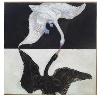
Hilma al Klingt